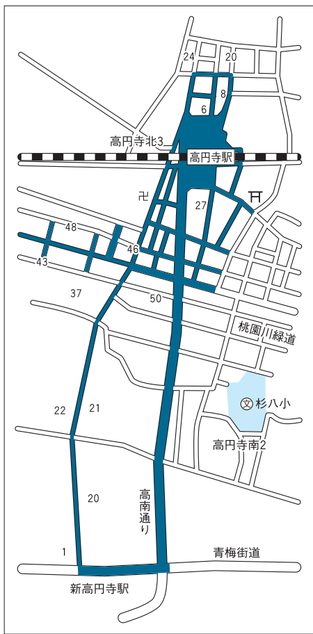
高円寺駅周辺 = 高円寺北2・3丁目、高円寺南2～4丁目