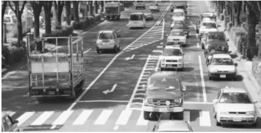
▶青梅街道・善福寺3丁目付近