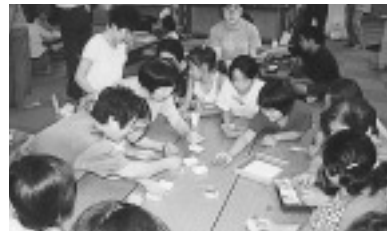
活動風景「和田堀寺子屋」

民生委員は、厚生労働大臣から委嘱されている福祉全般にわたるボランティアで、全員が児童委員を兼ねています。区内の民生委員・児童委員423名のうち、396名はそれぞれの担当区域を持ち、27名は主任児童委員として児童福祉に関する分野を専門に担当しています。