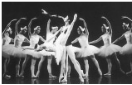
スターダンサーズ・バレエ団

目「第一部」きらめくオーケストラ「舞踏会の美女」(アンダーソン)ほか 第二部「世界一美しいバレエ音楽にのせて」日本フィル・夏休みコンサートオリジナル版「白鳥の湖」から情景/四羽の白鳥