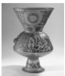
モスク・ランプ (エジプト14世紀)

エジプト・フスタート遺跡で発見された考古資料と、所蔵の美術品の両面からイスラームガラスをみていきます。(区共催)