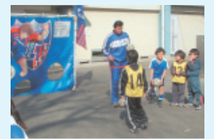
キックターゲット