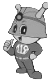
▲消防署のマスコットキャラクター・キュータ

時11月14日(木)～17日(日) 午前10時～午後5時 場下表のとおり(無料)当日、直接会場へ(杉並消防署馬橋出張所☎3314 0119)主催=杉並消防署