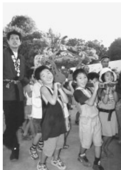
みんなでワッショイ!

そして「夢みこし」には、まつりに集まった子どもたちが、思い思いの夢や願い事を、色とりどりの短冊に書いて、はり付けました。この日は真夏日となりましたが、井草囃子保存会の人たちによるお囃子にのって、たくさんのおみこしを担ぐ子どもたちの「ワッショイ、ワッショイ」という元気な声が校庭に響きました。