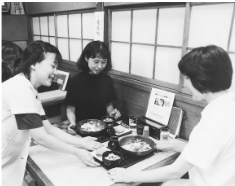
ヘルシーメニューで夏バテ防止

7月17日、杉並保健所において第3回認証式が行われ、西荻窪・荻窪・阿佐谷南地域にヘルシーメニュー推奨店が新たに誕生しました。(下表)