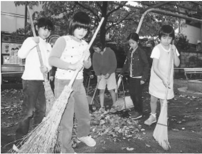
いつもの公園をみんなできれいに