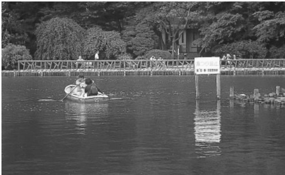
善福寺公園(善福寺3 18)

現在の「実施計画」を策定してから2年が経過し、その間、区政を取り巻く環境は激しく変化しています。少子高齢化の進展や環境問題への関心の高まり、教育を取り巻く環境の変化などに伴い、緊急に区政が対応すべき新たな課題も生じています。