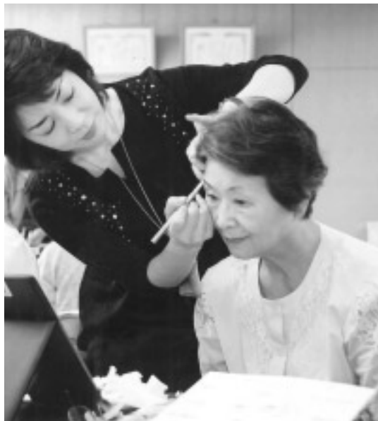
いつまでも若々しく(メイクアップ教室)

15) 時間 午前10時～11時50分/午後 午前10時～11時50分/午後 の部 午後2時～3時50分 〔内〕典 敬老会・半寿顕彰 ①保育園児・高校生からの お祝いのメッセージ 演芸 ②いきいきクラブ(老人 クラブ) 演技 ③ボランティア