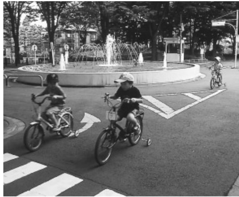
児童交通公園(成田西1 22)

この二年間、スマートすぎなみ計画(行革実施プラン)に基づき、全庁あげて行革に取り組んでまいりました。