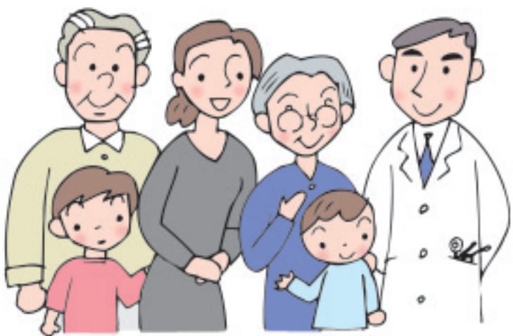
〈表1・70歳未満の方の自己負担限度額〉