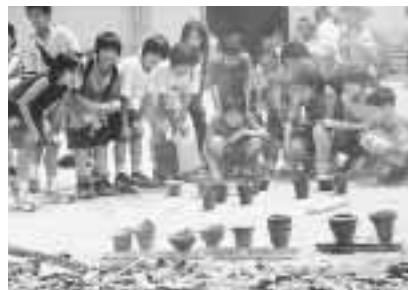
土器づくりが楽しかった！

四〇分ほどして薪が燃え尽き、土器が取り出されると、子どもたちは自分の土器に駆け寄り、四時間もかけて苦労して作ったから、割れないか心配なんだ。野焼きの最中に割れた土器は、校庭の一角に薪を並べ、火床を作ります。火床の周囲に子どもたちが作った土器を置き、火の勢いが強くなってきたところで土器を火床の中心に移動、さらに周りに薪を三〇センチほど積み上げます。火が燃え上がり、校庭は熱で息もできないほどです。