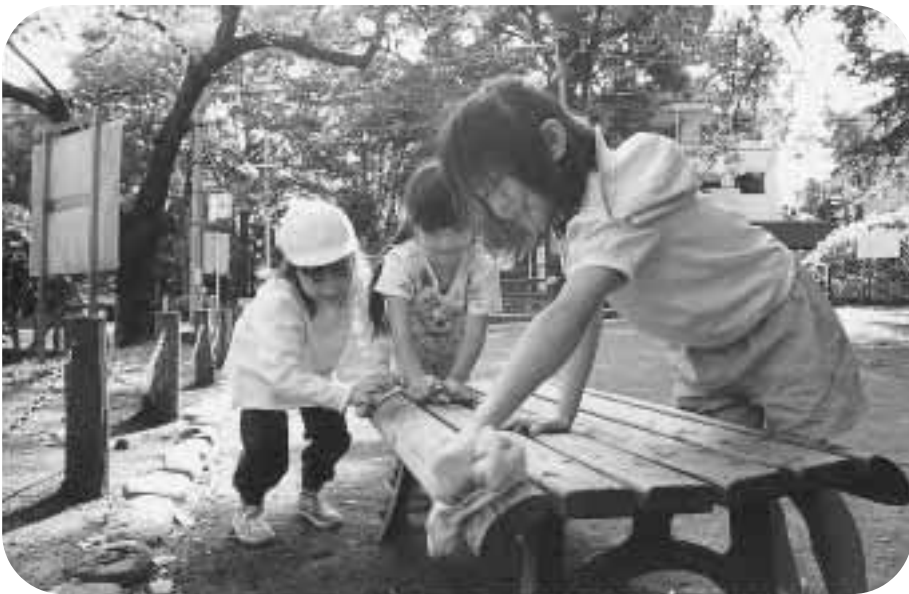
笑顔でおそうじ！ベンチも心もピカピカに

昨年、「世紀の大掃除」として実施したクリーン大作戦は、延べ六六〇〇名の参加があり、大きな成果を上げることができました(下表)。あらためて「わがまちクリーン」をきれいにしていくというきつかけになりました。参加した皆さんからは、毎年続けていくことが大切であるとの声が多く寄せられました。そこで区は「環境先進都市」を目指す中で、「区民の一人ひとりが実行委員」を合い言葉に、今年もクリーン大作戦を実施します。