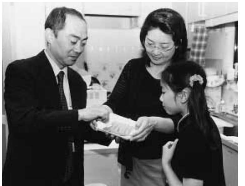
うちの冷蔵庫の肉は大丈夫かな?

食中毒菌は熱に弱いので、最も効果的な殺菌方法は加熱すること。調理する時には、食材の「中心部」を七五で一分間以上「を心がけましょう。ハンバーグなどのように、ひき肉から作る場合は、中心までの加熱が難しいので、フライパンにふたをすると加熱しやすくなります。