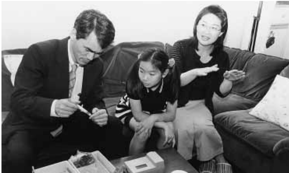
検査の様子に興味津々

蒸し暑くなり、O157(腸管出血性大腸菌)などによる食中毒が発生しやすい季節になりました。一般のご家庭を訪問して、食中毒予防のこつを勉強してみましょう。