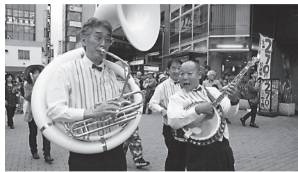
New Dixie Modern Boys

◇ Street Sites (free of charge): 8 locations (in front of JR Asagaya Station, Sugunami City Office and Asagaya