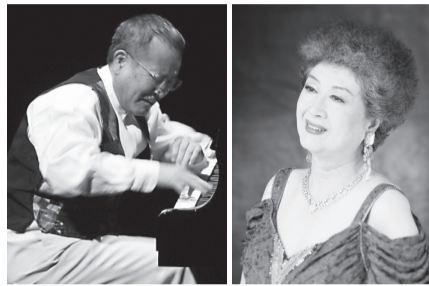
山下洋輔 マーサ三宅

◇ジャズバラエティ会場(別料金) …ライブハウス、レストラン、喫茶店ほか約30カ所