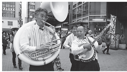
ニューディキシーモダンボーイズ