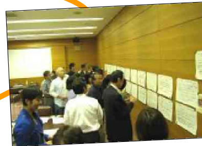
を張っていき投票！ 5つで当選！