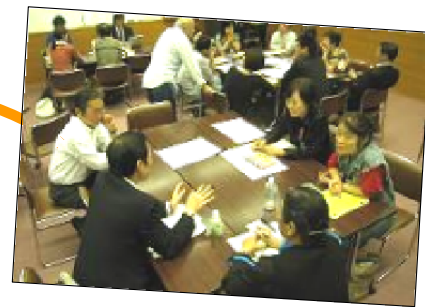
好きなグループに入って企画会議開始！