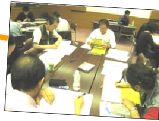
張り出された資料をみるぞ