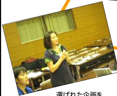
選ばれた企画を 説明