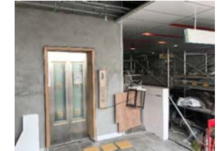
地下2階出入口工事写真(平成29年7月25日時点)