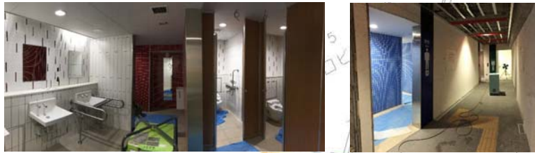
地下1階拡幅工事写真(平成29年7月25日時点)