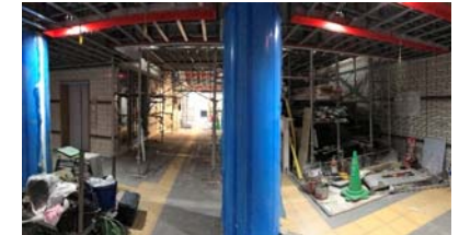
地下2階出入口工事写真(平成29年7月25日時点)