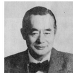
無所属 ドクター! 中松 無所属

都税減税! 消費増税の成功さす唯一のプロジェクト ○「がんばれ日本」標語創案 ○世界天才会議議長を27年間、国際イベントのプロ ○予想される激増を理系知事だから科学的に解消できる ○「ダントツの世界発信力」 ○「ハバード」の大学、MITなど世界の大学で講義 ○世界各地にドクター・中松記念日制定 ○米科学学会で「歴史上五大科学者」に選ばれた ○映画「ドクター・中松の発明」が世界中でヒット、映画賞受賞多数 政策 ○トラックマネーで失われた、東京の国際的信用を回復する ○地震の予知だから、首都直下型地震から都民を守る ○「脱原発」や「原発推進」では、対策がないのでダメ、原発は19世紀の技術、21世紀のパワーグリッドエンジニアリングで解決 ○東京を世界の「スマートシティ」にする ○新国立競技場の設計見直し、建設費を削減して済ませる