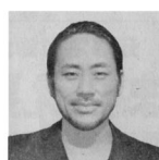
いらいり 家入 かずま 35歳 一真

ぼくらの東京の未来を、一部の古い政治家だけに決めさせやいけない。この選挙を通じて、ぼくらで一緒に考えていこう。みなさんの声を集めて、今までにない政策をつくっていきませう。 あなたが日常の中で感じる小さな疑問やアイデアを twitter/facebookから「#ぼくらの政策」とともに投稿してください。