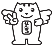
明るい選挙キャラクター 選挙のめいすいくん