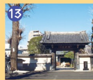
13 松林寺 かつては周辺に松が多かったといわれています。今は山門前に4本の大イチョウがあります。