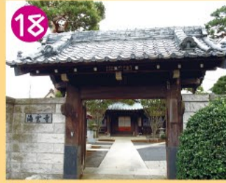
18 海雲寺 本堂は明治20年建立です。山門は江戸城内の紅葉山から移築した由緒ある建物です。