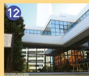
12 高井戸東遺跡 清掃工場を中心に3万4千年前の石器類が発掘された、国内有数の旧石器時代の遺跡です。