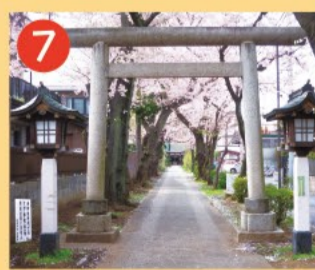
7 田端神社 150mの桜並木の参道が続いており、境内には木製の鳥居・力石・庚申塔などがあります。