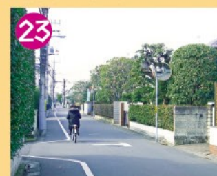
23 神明通り 大宮前新田開発のときに作られた直線道路です。現在は緑の多い住宅街となっています。