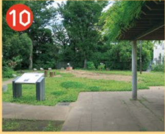
10 与謝野公園 与謝野鉄幹・晶子夫妻の旧居跡につくられた公園です。夫妻の歌碑があり、近くの桃二小の校歌は晶子の作詞です。