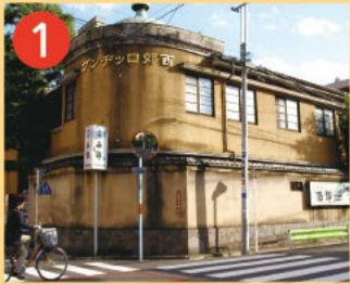
1 西郊ロッキング 昭和初期に胸付き高級下宿として建てられた建物です。国の登録有形文化財です。