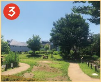
3 読書の森公園 区立中央図書館に隣接し木陰で本が読める公園です。図書館側にガンジエ像が建てられています。