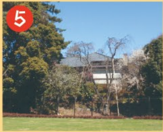
5 荻外荘 国指定史跡 ※現在は公開していません 荻外荘は、昭和戦前期に総理大臣を3度務めた政治家、近衛文麿の別邸です。平成28年3月に国の史跡に指定されました。