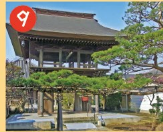
9 中道寺 黒眼の日蓮上人像が祀られており、鐘楼と山門を兼ねた鐘楼門は区内では珍しい建物です。