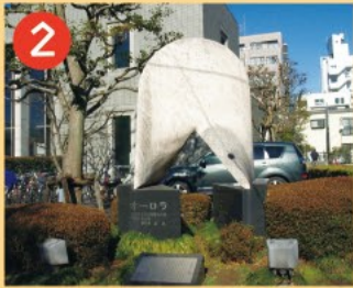
2 オーロラの碑 かつてここにあった区立公民館から原水爆禁止運動が発祥したことを記念して建てられました。