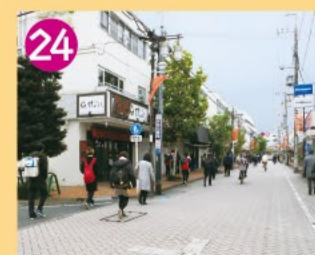
24 浜田山メインロード 京王線浜田山駅から井ノ頭通りまで300m続く、道幅も広く歩きやすい商店街です。