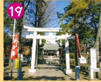
19 須賀神社 旧成宗村の鎮守です。隣接して近世に水信仰の中心となっていた成宗井財天社があります。