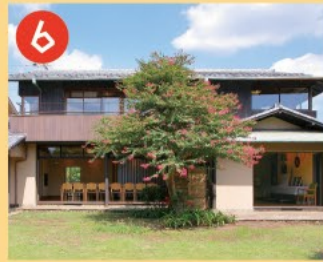
6 角川庭園 角川源義氏の旧邸宅を活かした庭園です。園内の幻戯山房は国の登録有形文化財です。