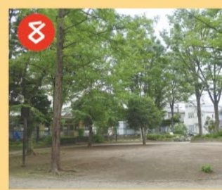
8 松溪公園 縄文中期の遺跡が埋藏された都内初の遺跡公園です。ケヤキやコナラが多く武蔵野の風情を残しています。