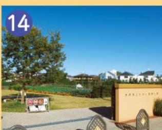
14 成田西ふれあい農業公園 農に親しみ場として、気軽に土とふれあい、農を「見る」「ふれる」「楽しむ」ことができる公園です。