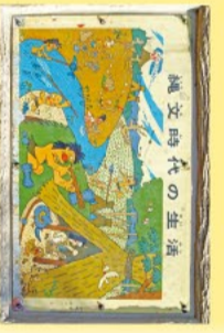
松溪公園大ヶ谷遺跡

杉並区は武蔵野台地の中央部に位置しており、荻窪南地域には善福寺川が蛇行して流れ、その川沿いは低湿地でした。周囲の台地は海抜高度の低い平坦面です。関東ローマ層と呼ばれる火山灰で覆われています。この台地からは、旧石器時代から古墳時代にわたる多くの遺跡が発見され、約3万年前から人々が住んでいたことが分かります。