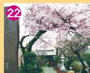
22 宝昌寺 本堂は大正10年の再建です。多くの石造物があり、6基が区指定文化財となっています。