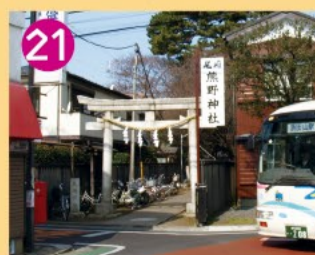
21 尾崎熊野神社 旧成宗村尾崎の鎮守です。境内から縄文前期の遺跡が発掘され、また黒松の巨木があります。