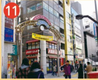
11 荻窪南口仲通り商店街 荻窪駅南口から南へ環八通り近くまで450m続く、何となく懐かしくほっとする活気もある商店街です。