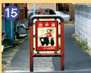
15 金太郎の車止め かつて多くあった水路を暗渠にした遊歩道です。金太郎の描かれた車止めは今では少なくなりました。