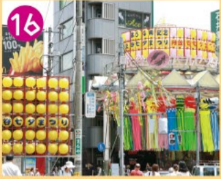
16 阿佐谷パルセンター 阿佐ヶ谷駅から青梅街道まで700m続く賑やかなアーケード商店街です。8月に催される七夕まつりは有名です。