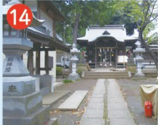
14 久我山稲荷神社 旧久我山村の鎮守。7月の夏祭りには「湯の花神楽」が奉納され、額堂付神楽殿には多くの絵馬が保存されています。