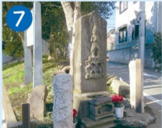
7 庚申塔 享保7(1722)年に建立された区内最古の道標付庚申塔。左右の側面に井の頭と府中への道しるべが刻まれています。