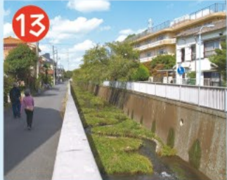
13 神田川 井の頭池に源を発し両国橋脇で隅田川に合流する長さ24.6kmの川。江戸時代は神田上水と呼ばれ、江戸市民の飲み水に利用されていました。