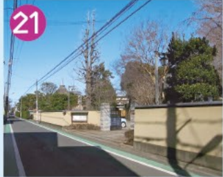
21 鳥山寺町 関東大震災後に被害にあった都心の寺院が世田谷区北鳥山に移転し、26の寺院が連なるこの場所は、世田谷の小京都と呼ばれています。