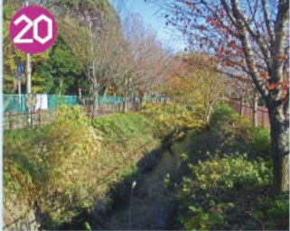
20 玉川上水 水路の両岸はみどり豊かな雑木林の風情を残しており、国の史跡に指定されています。