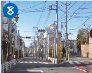
8 人見街道 区内の古道の一つで近世以前は東西を結ぶ重要な街道。道筋に神社・寺・石仏などの文化財が点在しています。