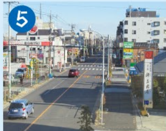
5 井ノ頭通り 境浄水場と渋谷を結ぶ道路で、和田掘給水場までは水道管が道路下に敷設されており、以前は水道道路と呼ばれました。