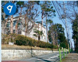
9 東原遺跡 後期旧石器時代(約3万年前)からの遺跡。神田川両岸の台地上には、早期縄文時代の遺跡が集中しており、縄文人が定着していました。