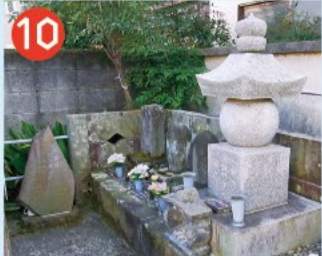
10 旧円光寺歴住墓碑 明治初年に廃仏毀釈により廃寺された円光寺の歴代住職の5基の墓碑。本尊の馬頭観音は宮前にある慈宏寺に移されています。