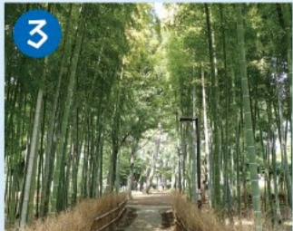
3 宮前公園 聴覚をテーマにした7つのオブジェが設置されています。区内では珍しく竹林のある公園です。