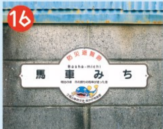
16 久我山地区の通称名称 その地域に住む一部の人だけが分かる「通称名称」があります。この地区は、通称名称を看板にしているの、探してみましょう。