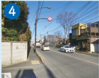
4 五日市街道 新高円寺駅付近で青梅街道から分岐し、あぎる野市に至る街道で、江戸時代には薪炭・農産物の運搬に使われました。