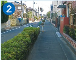
2 西萩南一丁目歩道 中央線建設時の湧水や雨水を善福寺川に流すためにつくられた排水路(大宮下地下水)が暗渠化され遊歩道になりました。