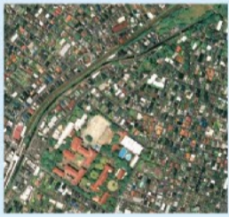
井の頭公園と神田川

杉並区は武蔵野台地は、多摩川が作った青梅を中心とする広大な扇状地です。標高50mの等高線付近は湧水が発達しており、この地域の地域では湧出した地下水が井の頭池を形成し、その流れが神田川となっています。神田川の両岸の台地上には、先土器時代から縄文・弥生・古墳時代に至る遺跡(東原遺跡・向ノ原遺跡など)があり、この地に古くからの人の住んでいたことがわかります。