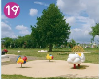
19 高井戸公園 王子製紙富士見ヶ丘グラウンドほかの跡地にできた公園です。開放感のある芝生広場が一面に広がります。