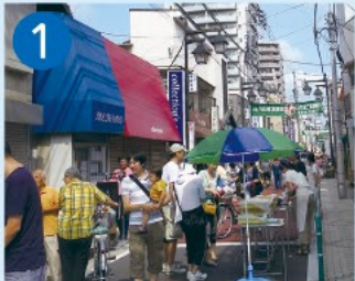
1 西萩のあさ市 昭和50年から毎月第3日曜日に神明通りの一部を車両通行止めにして、沿道の商店が朝市を開いています。