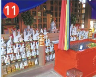
11 西高井戸松庵稲荷神社 旧松庵村の鎮守。境内にある元禄銘の庚申塔に松庵新田と刻まれており、松庵村は元禄より古いことが分かります。