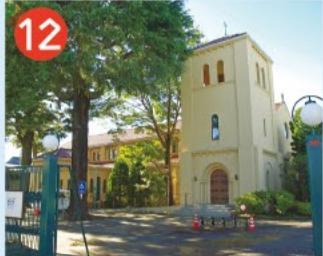
12 立教女学院 明治10(1877)年に創立され、関東大震災後、当地に移転してきた女子校(小中高・短大/幼稚園)。聖マーガレット礼拝堂は杉並区指定文化財です。