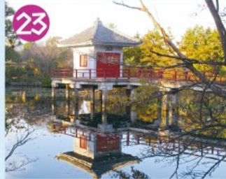
23 高源院 境内には樹木が多く、湧き水の涸れることのない池は、冬に多くの鴨が飛んでくるので鴨池と呼ばれています。