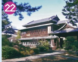
22 妙寿寺 境内はうっそうとした大きな木が多く、客殿(旧蓮池藩鍋島家邸宅)は世田谷区指定有形文化財です。(客殿は非公開です)