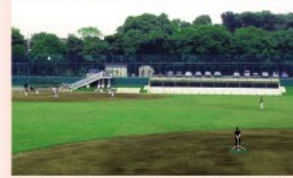
9 和田堀公園野球場(調節池)

この地域には善福寺川が蛇行しながら東流して、中野区との区境で神田川に合流しています。かつて流域には水田が広がっており、洪水時に遊水地の役割を果たしていました。現在、東側の流域は和田堀公園を中心としたみどりが広がっており、上流の善福寺川緑地を含め風致地区に指定されています。付近の野球場やテニスコートには、洪水時の調節池に活用されているところもあり、善福寺川側に横長の大きな取水口が設置されています。