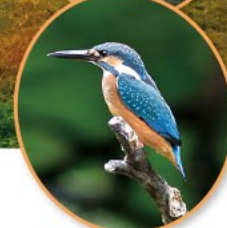
8 カワセミ(和田堀池)

豊かなみどりが残り水辺や水路跡にも親しめるこの地域で、古い歴史をもつお寺・神社や雑木林の原風景を楽しみましょう。