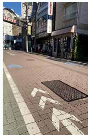
カラー舗装補助事業