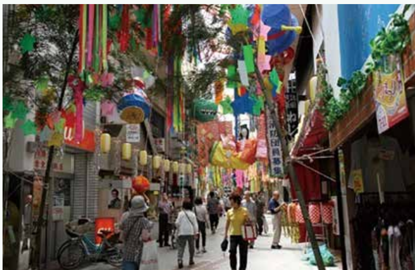
阿佐谷七夕まつり