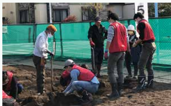
ジョブトレーニングコーナー(すぎトレ)事業所訓練