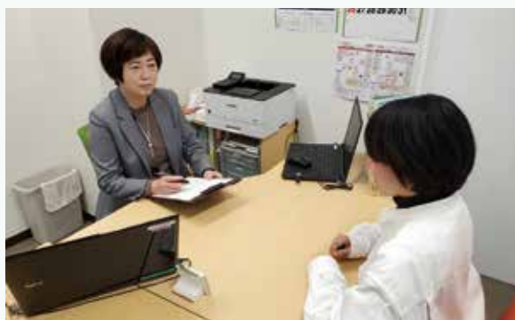
若者就労支援コーナー(すぎJOB)就労準備相談

注) 新型コロナウイルス感染症の影響により、例年に比べ数値が減少しています(参考:平成30年度(2018年度)実績719人)。