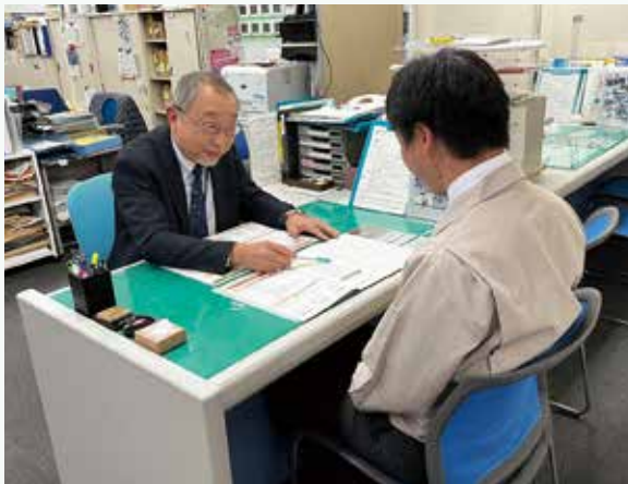
中小企業資金融資あっせん及び商工相談窓口