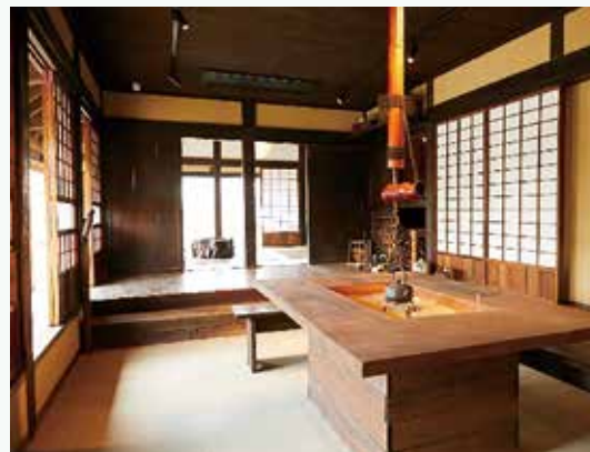
すぎのご農園管理棟