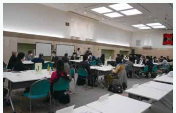
異業種交流会 in すぎなみ