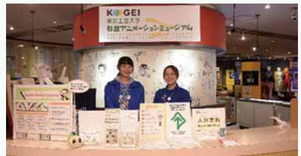
杉並アニメーションミュージアム