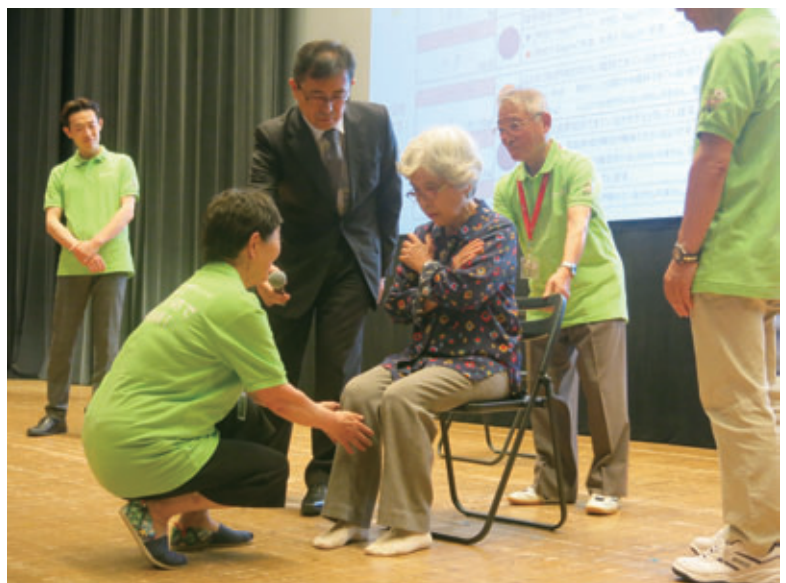
フレイルサポーター

住民主体の健康長寿活動として全国展開を目指しているフレイル予防活動。杉並区では9月にサポーター養成研修が行われ、西東京市に続いて東京都で2番目に取り組む自治体になろうとしています。