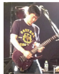
ライブ演奏に熱が入ります