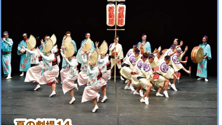
座・高円寺阿波おどり2014