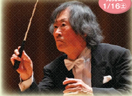
小林研一郎