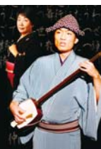
開場は開演の30分前 ★託児あり

過去に心中した二人が時空を超え、現在に転生して…。江戸浄瑠璃の心中モノ『明烏』をベースに、古典楽曲、現代舞踊、民族音楽を織り交ぜた、エンターテインメント性溢れる舞台をお届けします。