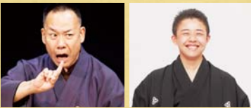
古今亭志ん輔 桂吉坊