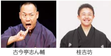
古今亭志ん輔 桂吉坊

C「古今東西 挑むは、はんなり 若旦那」2/14(日)18:00 座 古今亭志ん輔、桂吉坊