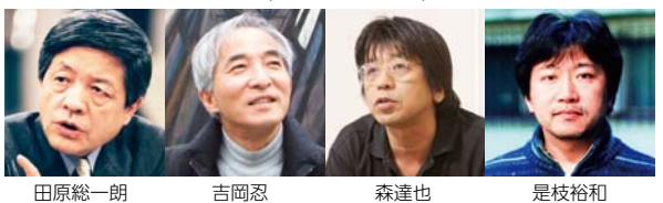
田原総一郎 吉岡忍 森達也 是枝裕和

映画・テレビの枠を超えて、ドキュメンタリーの魅力と可能性を再発見する映像の祭典。「知られざる世界」にカメラを向け、新しい価値観を発見していく、そんなドキュメンタリーの本質と向き合います。 プログラムディレクター 山崎裕 ゲストセレクター ほか 田原総一郎、吉岡忍、森達也、是枝裕和 ほか ※作品ラインナップ等の詳細は公式HP(http://zkdf.net/)で発表します。 座・高円寺2 前売1,300円、当日1,500円