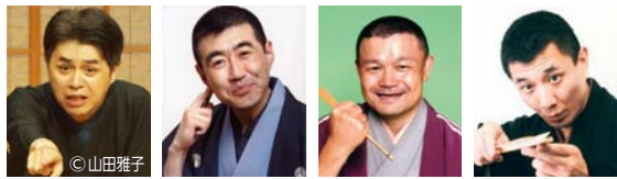
立川志らく 春風亭柳好 林家彦いち 三遊亭兼好

座 高円寺2 全席指定/A・C:一般3,000円、中学生以下1,000円/B:一般1,500円、小学生以下500円 A「百花繚乱! 四派そろい咲き」2月13日(土)18:00 座 立川志らく、春風亭柳好、林家彦いち、三遊亭兼好