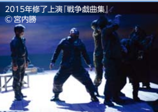
2015年修了上演「戦争戯曲集」

舞台芸術の次代を担う劇場人を目指して2年間、座・高円寺で学んできた「劇場創造アカデミー」の学生たちの、研修の締めくくりとなる修了上演です。これまで取り組んできたイギリスの劇作家エドワード・ポンドの「戦争戯曲集・三部作」を、今年合計8時間の完全上演に挑みます。