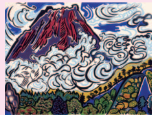
片岡球子《積乱雲の中の富士》 女子美術大学美術館所蔵

女子美術大学は110年以上にわたる歴史のなかで、美術史に残る著名な女流作家を数多く輩出してきました。本展覧会では、女子美術大学美術館所蔵のコレクションの中から大久保婦久子、片岡球子、佐野ぬい、三岸節子など本学卒業生の作品をご紹介します。画家たちの研ぎ澄まされた感性により生み出された名品を、どうぞお楽しみください。