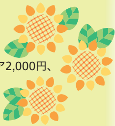
川瀬賢太郎