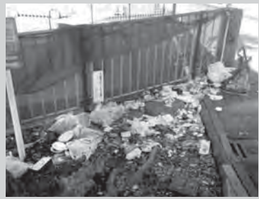
問 杉並清掃事務所方南支所