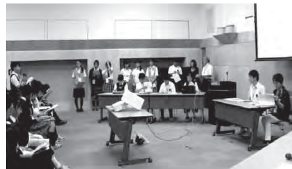
▲昨年の「中学生環境サミットの様子」