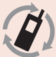
モバイル・リサイクル・ネットワーク 携帯電話・PHSのリサイクルにご協力を。

モバイル・リサイクル・ネットワークHP http://www.mobile-recycle.net/