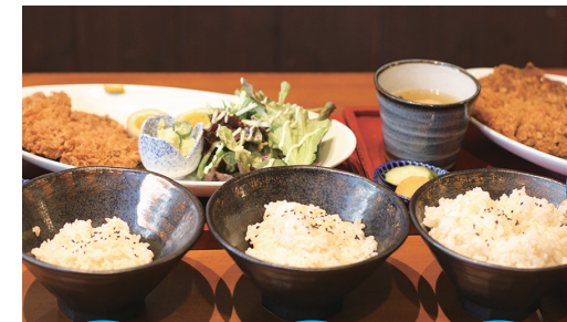
小盛 普通 大盛

小盛りメニュー、ハーフメニュー、持ち帰りメニューなど食品ロスの削減に取り組んでいるお店です。