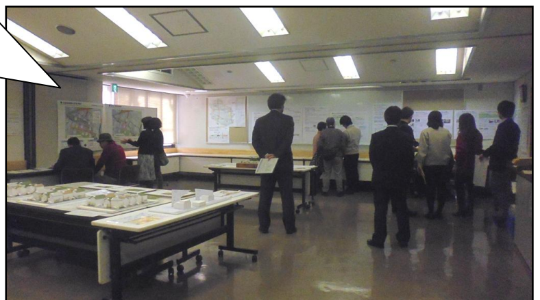
【2月14日のオープンハウスの様子】

※時間帯によっては混雑することがあり、職員が対応できるまでお待ちいただく場合があります。予めご了承ください。