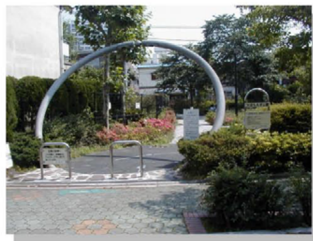
公園整備の事例 (天沼三丁目もえぎ公園)