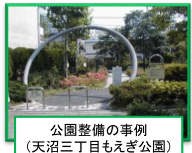
公園整備の事例 (天沼三丁目もえぎ公園)