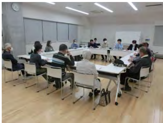
まちづくりを進める会の様子