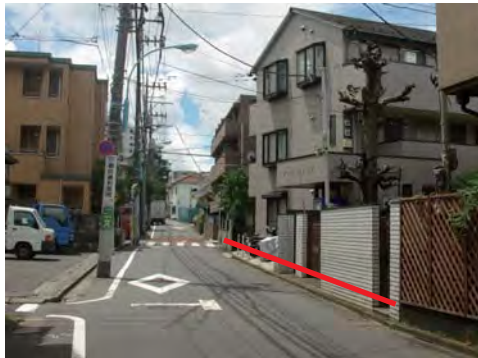
拡幅前（平成21年当時）