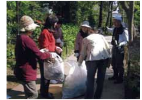
活動は気軽に、楽しく!