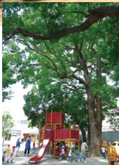
上：大学正門からつづくみどりの並木。左：幼稚園のシンボルツリー・クスノキ