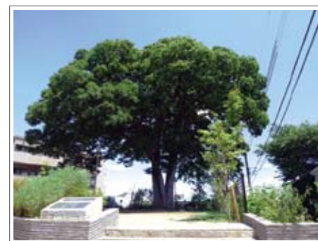
大ケヤキがシンボルの「坂の上のけやき公園」