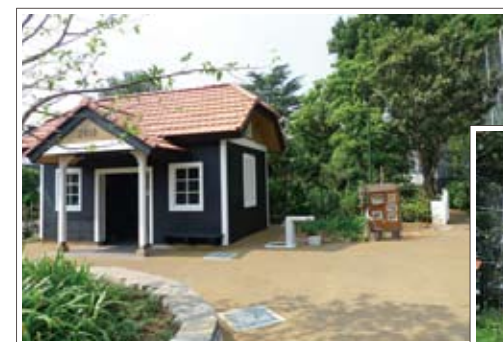
昭和初期の面影を残す「Aさんの庭」