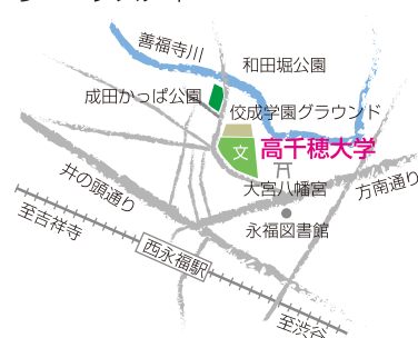
※校内に立ち入るときは守衛さんに一声かけて、また授業の妨げになる行為はしないよう、お願いします。