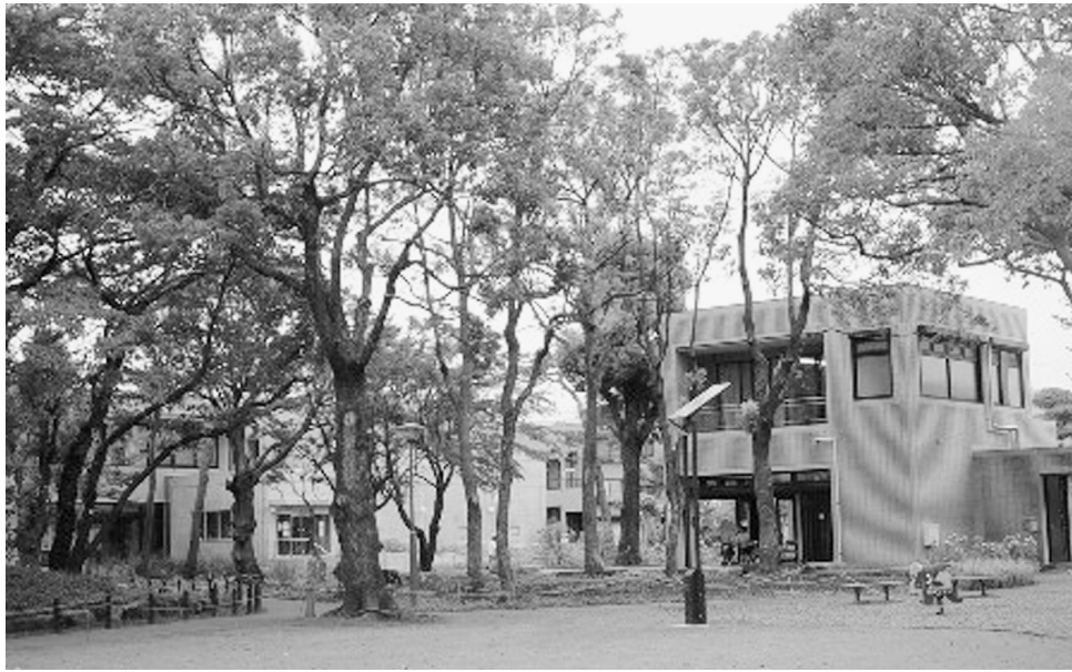
4月7日にオープンした天沼弁天池公園（天沼3-23-1）

http://www.gikai.city.suginami.tokyo.jp/ 携帯サイト http://www.gikai.city.suginami.tokyo.jp/mobile/