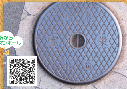
駅からマンホール