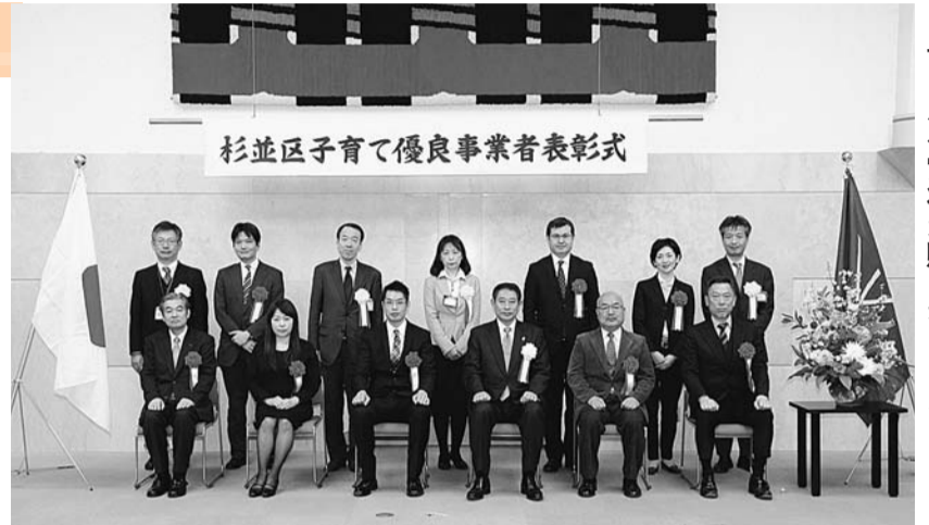
▲1月25日(月)に、区長から受賞者の皆さんへ賞状が贈られました

また、近隣の親子等を招いて施設内で餅つきのイベントを開催したり、近隣の小学校で開催しているお祭りに出店するなど、地域の子ども・子育て支援活動を実施しています。