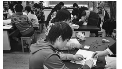
▲さいえんすタイム

学校支援本部は地域の方々と、区立小中学校の教育活動を支援するために設置された組織です。桃井第五小学校学校支援本部では、「芝生を育てる会」(校庭の芝生管理)、「おはなし宅急便」(全クラスに読み聞かせ)、「エプロンの会」(本の貸し出しや補修)、「おやじの会」(週末のイベント対応など)といった活動を地域の方々と連携し、先生方やPTAをサポートしています。また土曜授業を中心に、桃井第五小学校の特色である「さいえんすタイム」では、子どもたちと一緒に楽しく活動しています。活動の詳細はすぎなみ地域コムからご覧ください。