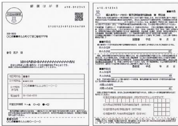
▲通知書が届くまでお待ちください