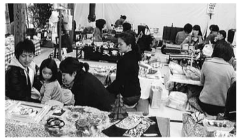
▲地域の人の交流の場となっている井荻会館

戦後の一時期、杉並区の出張所も置かれ、行政のお役にも立っています。築後80余年と老朽化が進んだため、28年度には外装をはじめとした改修工事が計画されていて、イメージチェンジが図られる予定です。当町会は防災・防犯に優れた実績があり、過去の大震災、先の大戦でも直接の被害は免れました。将来の甚大な災害に備え、荻窪中学校には震災救援所が置かれています。地域住民の避難救援の場となるよう、杉並区・井荻自治会・各商店会・消防団、民生児童委員、荻窪中学校、PTAで組織され、定期的な訓練、救助資機材の操作訓練を行っています。特に荻窪中学校レスキュー隊の若い力が期待されています。今後の町会の発展には、老若男女の会員方々に自治会行事に参加していただき、活発な活動・意見交換を行うことが必要と考えています。(青木武晴)