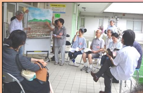
参加型朗読劇 ギター・ピアノとも即興 でセッション♪