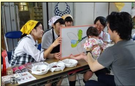
豆ガールズによる豆育紙芝居 食べ物コーナー