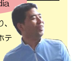
インド出張中の受講生より、 現地のホテルから中継! ホテルのスタッフと交流中