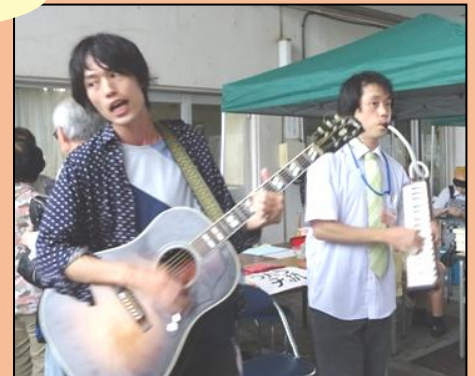
ギター・ヴォーカル&ピアノによる 「ポップな音楽会」