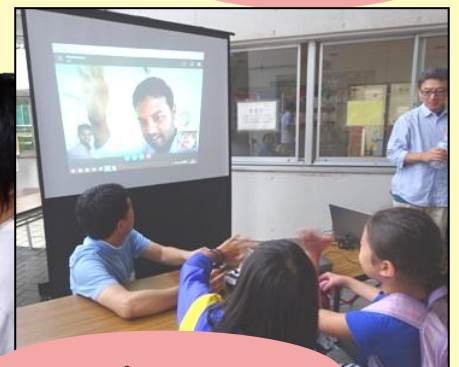
スカイプ from India