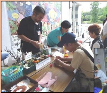
↑ 割り箸工作 & 松ぼっくりマスコット作り 超能力振り子→