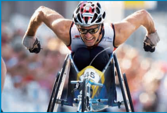
「車椅子マラソン」

(2/17(土)は特別開庁) シドニー2000パラリンピック以降、パラスポーツを国内外で撮り続けているドキュメンタリーフォトグラファー・越智貴雄の写真展。パラスポーツの世界や選手達の日常など、躍動感あふれる写真をぜひご覧ください。