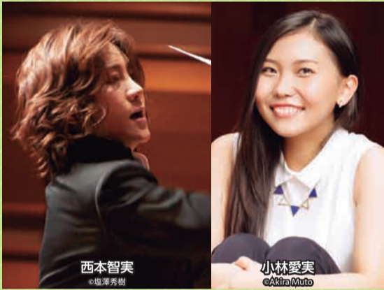
西本智実

曲 ラフマニノフ：ピアノ協奏曲第2番、交響曲第2番 チケット取扱 ▶ 公 ぴあ102-085 (託児)