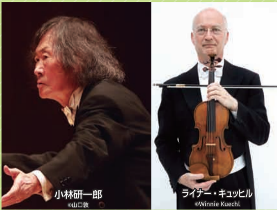
小林研一郎

曲 チャイコフスキー：ヴァイオリン協奏曲、交響曲第4番 チケット取扱 ▶ 公 ぴあ102-078 (託児)