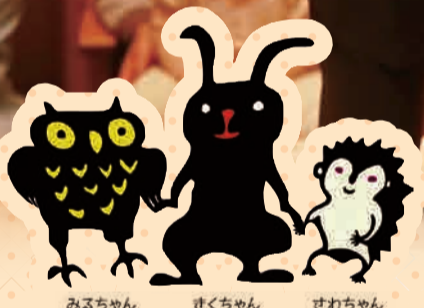
みるちゃん きくちゃん さわるちゃん

公会堂探検ツアーも あります! 普段は入れない ところにも入れちゃうかも。 杉並公会堂 東野