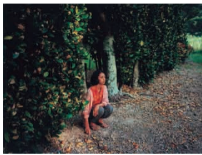
映画「海辺の生と死」より(※当日映画の上映はありません)

(日・祝は～17:00) ※8/3・17(木)は休館 「第一期魚雷艇学生」(85)の原稿(レプリカ)とその初出誌、中央図書館所蔵の書籍ほか、南相馬市ゆかりの文人・埴谷(はにや)雄高や荒正人関連の展示。 場 中央図書館1階特別展示コーナー(荻窪3-40-23) 問 中央図書館 ☎3391-5754