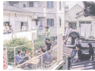
小杉湯ファンのつながりから生まれたプロジェクト