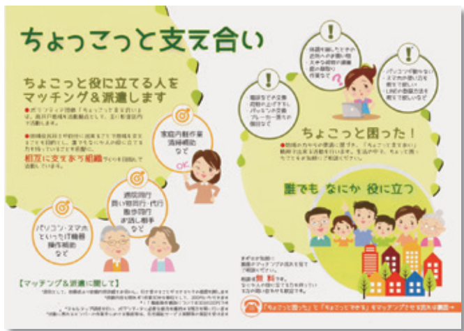
「ちょっとと支えあい」のチラシ