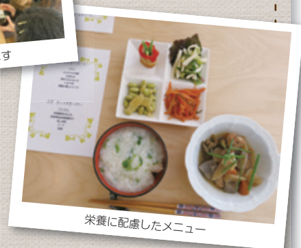
栄養に配慮したメニュー