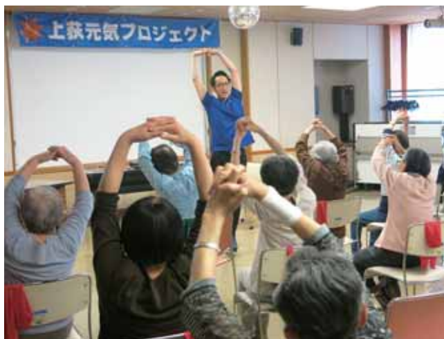
専門職の指導による体操教室

開催場所はゆうゆう西荻北館（第1金曜日）、ゆうゆう今川館（第2木曜日）、杉並会館（第3金曜日）、西荻地域