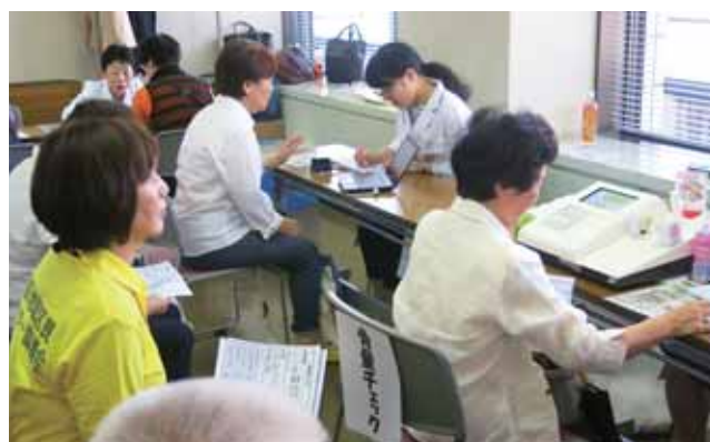
骨量・血管年齢などの測定

操教室を通して、元気なうちから地域のリハビリの専門職などと顔の見える関係がもてる場づくりです。参加者が専門職に相談できる場、専門職が早期に異変に気づき適切な支援につなげられる場、さらには、参加者同士の見守りや助け合いの関係が生まれる場、を目指した活動です。