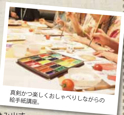
真剣かつ楽しくおしゃべりしながらの絵手紙講座。

*きずなサロンとは、地域の方々がふれあい、交流する場です。きずなサロンの活動をとおり、地域の方々の輪が広がり、支え合える関係ができることが期待されています。きずなサロンの活動は、杉並区社会福祉協議会が支援をしています。