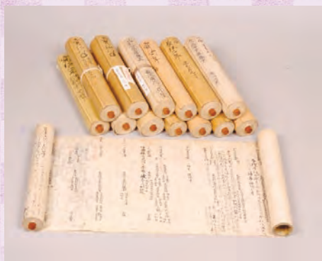
▲国宝「御堂関白記」全14巻

この世をば わが世とぞ思う より一千年 藤原道長とその時代 「御堂関白記」を中心に