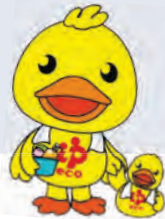
図12月22日(金)(開催日の異なる銭湯があります) 費460円。小学生以下無料 図大人はくじ引きあり