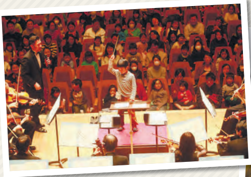
▲オーケストラ・コンサートでの指揮者体験

時30年3月21日(祝)①午前9時30分～午後1時15分②1時45分～5時30分(①②の入れ替え制) 場杉並公会堂(上荻1-23-15) 図オーケストラ・コンサート、楽器体験、サプライズライブ、リレーコンサートほか▶出演=永峰大輔(指揮)、日本フィルハーモニー交響楽団(管弦楽)ほか 費各回2500円(4歳未満膝上無料) 電電話で、杉並公会堂☎5347-4450(午前10時～午後7時。臨時休館日を除く)または日本フィル・サービスセンター☎5378-5911(月～金曜日午前10時～午後5時。祝日を除く) 図日本フィル「音楽の森」☎5378-6311 図推奨対象年齢4歳以上