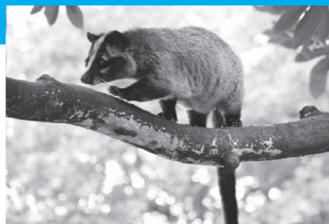
▲ハクビシン(顔の真ん中に白いすじがある)

問 環境課「有害鳥獣等相談 110番」 直通電話 03-5307-0665 平日午前8時30分～午後5時