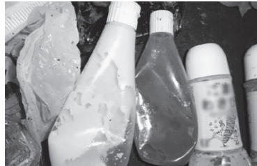
写真：資源化施設に持ち込まれた杉並区の非該当品