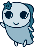
問 杉並清掃事務所、方南支所