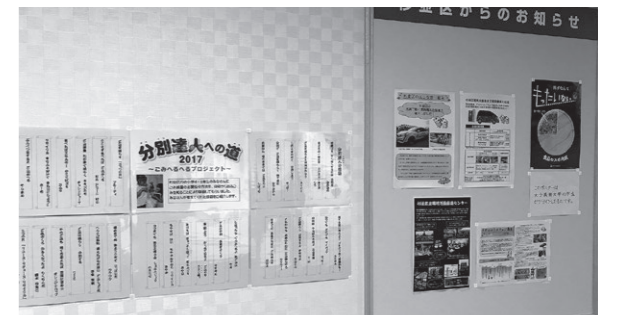
問 ごみ減量対策課事業計画係