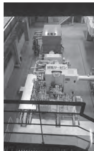
③蒸気タービン発電機

写真③ 焼却炉で燃やしたごみの熱で高温高圧の蒸気を発生させ、発電を行い、発生した電気を売電しています。