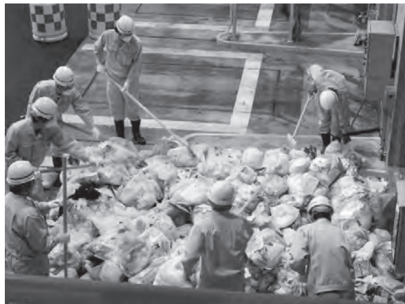
①プラットホームでの抜き打ち検査

写真① 可燃ごみの収集車は入口で計量後、プラットホームまで進み、ごみバンカに収集運搬したごみを廃棄します。当日、見学者は滅多に見られない「抜き打ち検査」が行われていました。「ごみバンカ」と呼ばれる「一時置き場（貯留）」へ廃棄する前に、ごみ収集車の中身がプラットホーム上に広げられ、特別な道具でごみ袋を開け、可燃以外のごみが入っていないかの確認をしていました。意外なところでの人力の必要性を感じました。