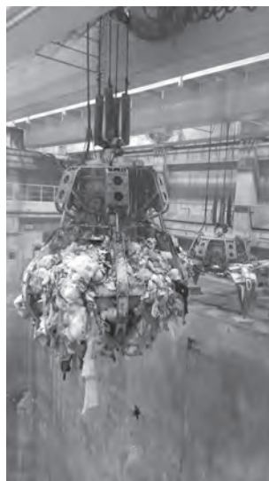
②ごみバンカとごみクレーン

写真② 運ばれて来たごみの「一時置き場（貯留）」がごみバンカで、ごみバンカに入ったごみはごみクレーンで均一になるようかき混ぜてから焼却炉に運ばれます。窓越しの見学ですが、巨大なごみクレーンがごみを掴みながらゆっくりと動く様子やつかんだ大量のごみに迫力を感じました。