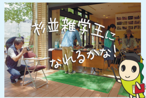
昨年の区民ライター講座の様子

まだアクセスしたことがない方は、ぜひサイトをご覧ください。わが町に関する新発見に出会えることでしょう。また、「区民ライター」活動に興味を持たれた方は、5月開講のすぎなみ地域大学の「区民ライター講座」を受講して、一緒に活動してみませんか? (ふ)