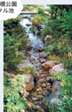
宮下橋公園ホタル池

ゲンジボタルの場合、幼虫が餌にするのが、カワニナという小さな巻き貝です。体ごと貝殻に潜り込み、口から消化液を出してカワニナの肉を溶かして食べます。成虫は餌を食べません。幼虫のころに蓄えた栄養と水だけで活動し、2週間ほどで寿命を迎えます。