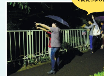
ホタルたちは繊細です。マナーを守って観賞しましょう!

図 6月9日(土)・10日(日)午後1時～9時 図 図 ホタル観賞(日没後) = 神田川会場、玉川上水会場、久我山稲荷神社▶ホタル生態説明 = 久我山中央緑地公園▶チビッコ園芸体験(10日)、各種模擬店、防災キャンペーンほか 図 久我山連合商店会事務所 ☎3333-6867