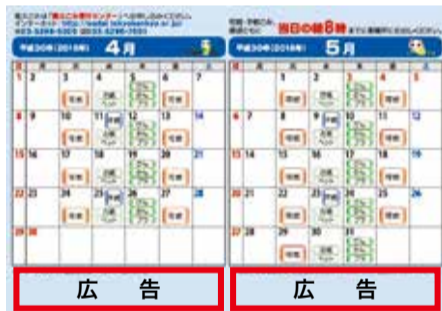
▲広告掲載のイメージ

図冊子規格=A4判カラー24ページ▶発行部数=約42万部▶掲載料=1枠5万円(版下原稿等の作成費用は広告主の負担)▶規格=縦3cm×横10cm▶掲載位置=カレンダー掲載ページの下部(掲載ペー